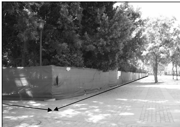
PRADO DE SAN SEBASTIÁN ZONA ACOTADA PARA DESTRUIR